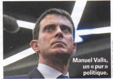
Manuel Valls, un « pur » politique.

L'Institut de recherches économiques et fiscales (Iref) a comparé les parcours professionnels des ministres français à ceux des Britanniques. Sur les 97 membres du gouvernement Cameron, 74 ont fait un passage en entreprise. En France, sur les 31 membres du gouvernement, seuls 7 ont fait un détour par le privé. Circonstance aggravante : en moyenne, quand les Britanniques ont passé dix ans en entreprise, les Français se sont contentés d'une petite année.